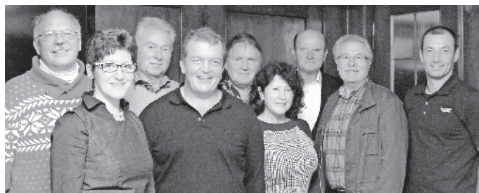
Im Auftrag Hermann-Josef Wolf