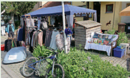
Guten Geschäfte in der Högestraße.