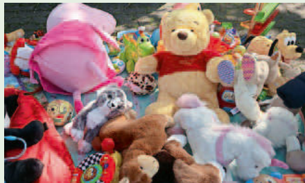
Für Kinder wurde viel angeboten.