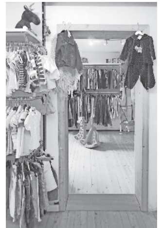
Schnäppchen finden im Second-Händchen