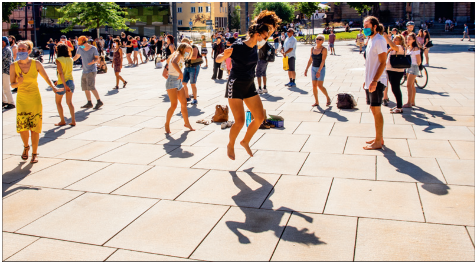
▲ disTanz. Freiburg lebt!