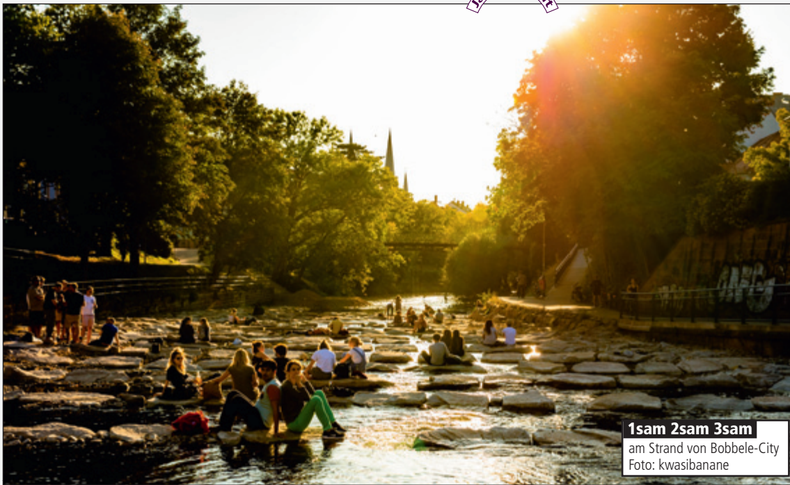
1sam 2sam 3sam am Strand von Bobbele-City