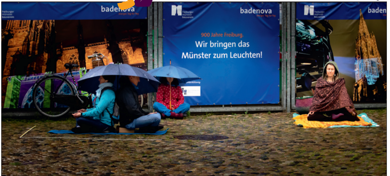
▲ Erleuchtung bei Regenwetter