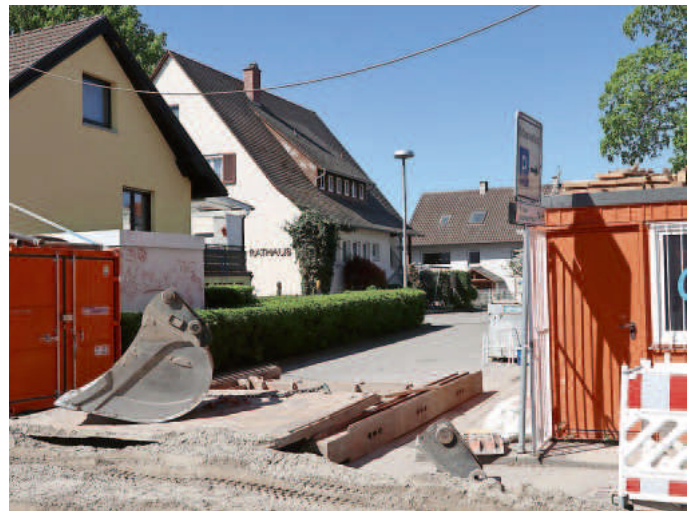
Die Kanalbauarbeiten bringen es mit sich: Die Zufahrt zur Ortverwaltung ist in den nächsten Wochen nicht möglich.

Wehrle: Ab Kalenderwoche 19 (04.05.20) beginnen wir mit den Straßenbauarbeiten ab Höhe Haus Nr. 10 bis Höhe Einfahrt Rathaus. Hier werden in diesem Zuge noch Glasfaserkabel mitverlegt, die Bordsteine teilweise neu versetzt, zusätzliche Straßeneinläufe (Gully) versetzt und Entwässerungsrinnen ergänzt. Die neue Asphaltsschicht der Straße/Gehwege etc. wird voraussichtlich bis Ende KW24 hergestellt. Teil-Fertigstellung und Freigabe bis einschließlich Zufahrt zum Rathaus sind ab KW 25 von Süden her möglich.