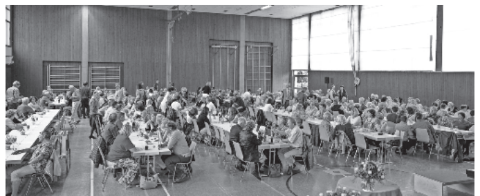
Bilder von Eberhard Jobst