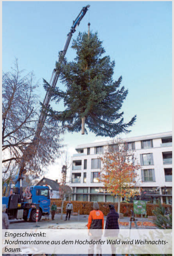
Eingeschwenkt: Nordmantanne aus dem Hochdorfer Wald wird Weihnachtsbaum.

Zum Abschluss dankte Ortsvorsteher Günter Hammer allen Handwerkern und Helfern_innen und lobte den schönen Weihnachtsbaum bei einem ortsüblichen Getränk für alle.