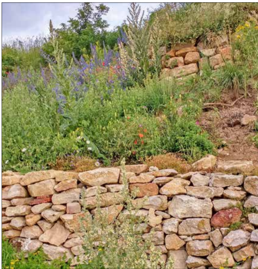
In Trockensteinmauern oder Lesesteinhaufen aus Natursteinen fühlen sich Eidechsen, Insekten, bestimmte Pflanzenarten und andere Kleintiere wohl.

Es gibt einen bunten Strauß an Vorschlägen, die sich in privaten Gärten, Vorgärten, Höfen, auf Grünflächen oder an Gebäuden leicht umsetzen und auch sehr gut kombinieren lassen. Etwa das Anlegen von artenreichen Wiesen und Säumen mit heimischem Saatgut – diese sind wichtige Nahrungsgrundlage für Insekten, und die wiederum Nahrungsgrundlage für viele andere Tiere wie Vögel und Fledermäuse. Gefördert wird auch das Pflanzen von standortheimischen Bäumen und Sträuchern, da diese der heimischen Tierwelt Brutmöglichkei-