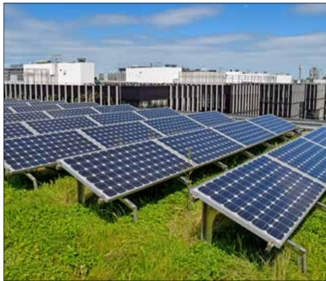
Bye-bye Kohle und Gas: Ein Solargründach (hier in München) hilft beim Klimaschutz und bei der Anpassung an den Klimawandel.

Was die Menschen sehr belastet, ist natürlich die Hitze. Die Auswirkungen auf die Gesundheit werden zunehmen, das Thema Hitze sollten wir für ältere und kranke Menschen nicht unterschätzen. Aber auch die Trockenheit und der Grünerhalt in der Stadt werden uns im Alltag beschäftigen: die Frage, wie wir die Stadtbäume pflegen, und natürlich auch, wie wir unser privates Grün und unsere Gärten erhalten können. Noch gravierendere Folgen kann aber ein punktueller Starkregen oder ein Hochwasser haben – das haben wir diesen Sommer im Ahrtal erleben müssen. Wenn ein solcher Regen kommt, dann können die Folgen wesentlich drastischer sein als durch Hitze.