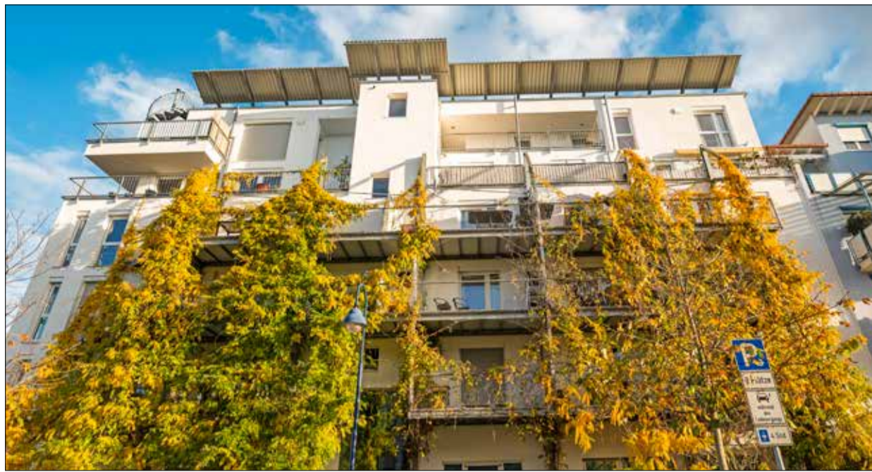
Wie schön: Eine begrünte Fassade ist nicht nur gut für den Arten- und Klimaschutz, sondern auch sehr hübsch.