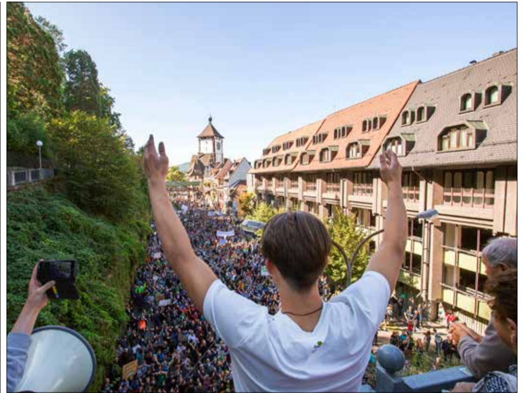
Jetzt bloß keine Panik: FreiburgRESIST will die Stadt für Großveranstaltungen, wie diese Demo von Fridays for Future im September 2019, digital wappnen.

„In Freiburgs Altstadt ist unglaublich viel los“, erklärt der stellvertretende EMI-Leiter Tobias Leismann die Ausgangslage. „Ob bei den