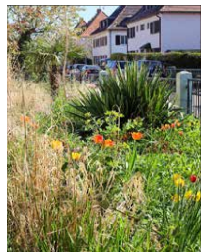
Paradies in der Stadt: Im Frühjahr wird der Garten zum Blütenmeer.

Im Garten der Familie findet sich vieles, was den unterschiedlichsten Tieren ein Zuhause bietet: Der alte, mit Efeu bewachsene Birnbaum hat leider den letzten Sturm nicht überlebt. Die siebenköpfige Drosselfamilie ist aber bereitwillig samt Vogelkasten auf den Nachbarbaum umgezogen. Im Teich ist Platz für Molche und Frösche, und in den alten Bäumen und am bewachsenen Balkon hängen verschiedenste Vogelkästen und Insekten tummeln sich. Oft kreisen abends die Fledermäuse über der Photovoltaikanlage, nun hofft Schmitt, dass sie bald in die neuen Fledermauskästen unterm Dach einziehen.