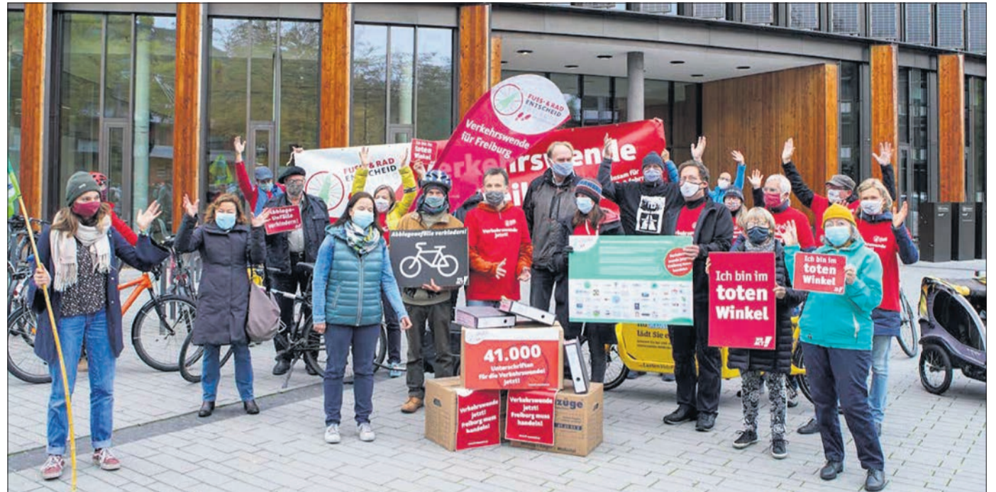
Verkehrswende jetzt: 41000 Freiburgerinnen und Freiburger haben sich im Herbst für ein radikales Umdenken in Sachen Mobilität ausgesprochen. Der gewünschte Bürgerentscheid war aus rechtlichen Gründen nicht möglich – das Thema aber bleibt aktuell: Auch beim Beteiligungshaushalt fand es mit weitem Abstand die meiste Unterstützung.

Bemerkenswert sind außerdem die engen Überschneidungen mit den Ergebnissen der repräsentativen Freiburg-Umfrage, an der 2600 Personen teilgenommen haben. Auch hier – siehe nebenstehender Artikel – haben die Themen des Umwelt- und Klimaschutzes sowie der Verkehrswende deutlich an Gewicht gewonnen, was darauf schließen lässt, dass die Forderungen der Fridays-for-Future-Bewegung