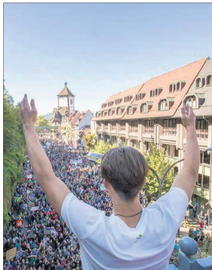
Fridays for Future mobilisiert die Massen – weltweit und längst nicht mehr nur junge Menschen. Die Umsetzung der Forderung landete auf Platz 3 im diesjährigen Online-Forum-Ranking.

auf breiten gesellschaftlichen Rückhalt stoßen.