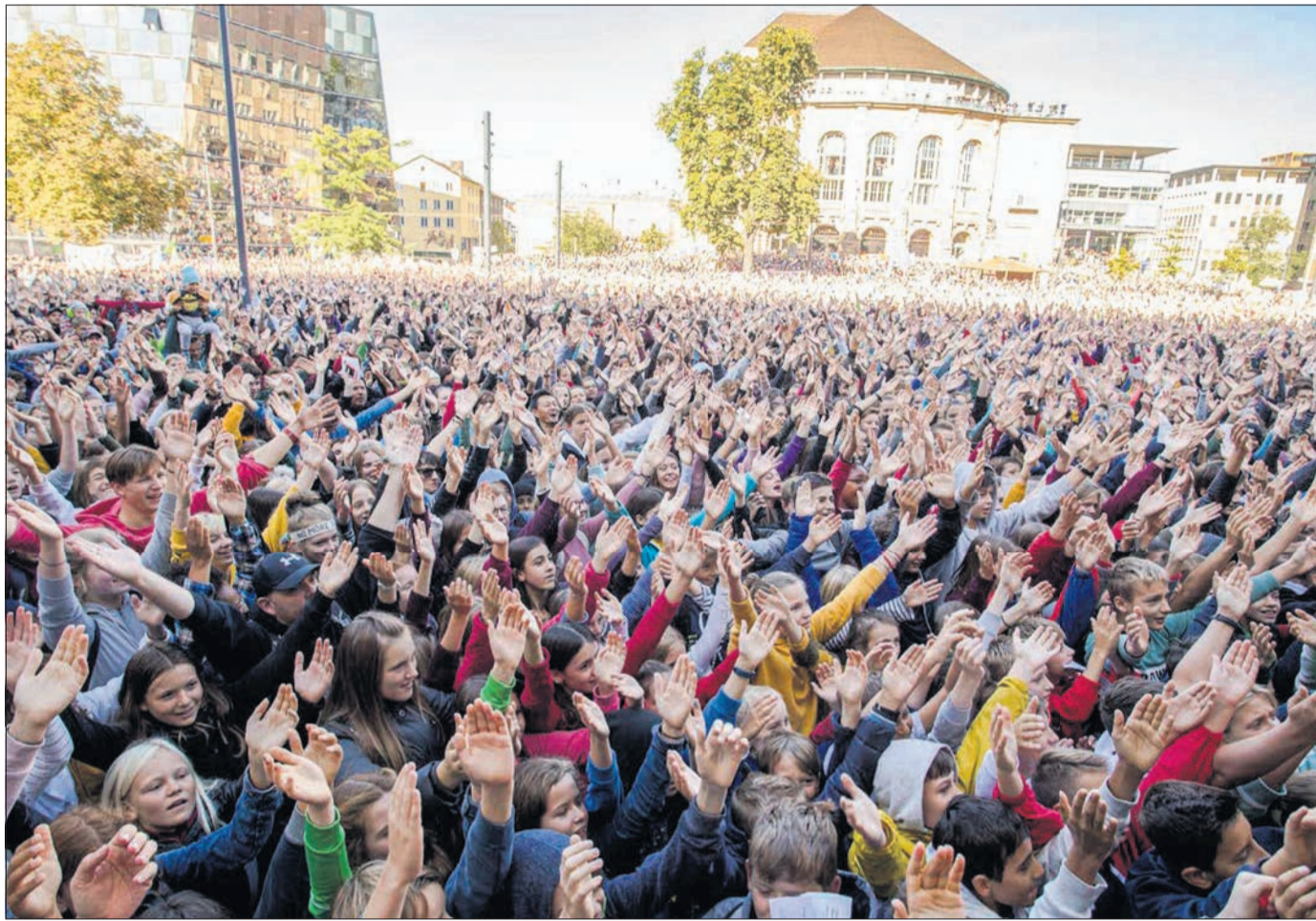
Der Ruf der Straße: Was bei Demonstrationen – wie hier von „Fridays for Future“ im September 2019 – gefordert wird, spiegelt sich in der Freiburg-Umfrage 2020 wider: Klima- und Naturschutz sind den Bürgerinnen und Bürgern wichtig, stehen auf Platz zwei und fünf der Prioritätenliste. Thema Nummer eins ist nach wie vor der Wohnungsbau.