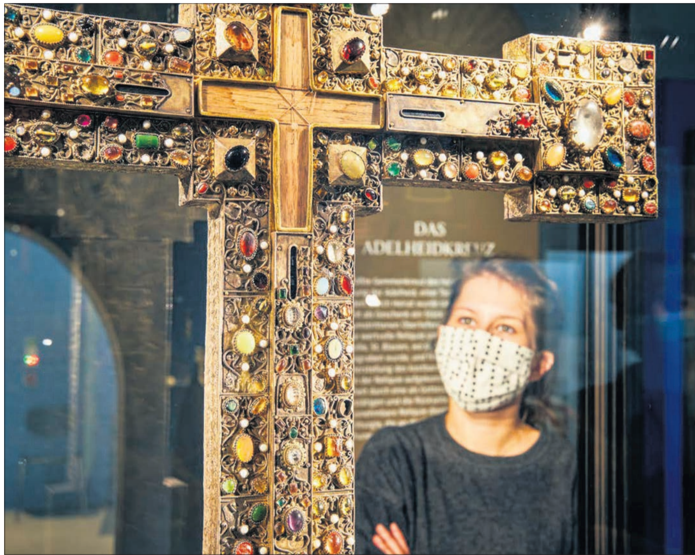
Wertvolle Reliquie: Das Adelheid-Kreuz stammt aus dem 11. oder 12. Jahrhundert, ist 82,9 Zentimeter hoch, 65,4 Zentimeter breit und 7,4 bis 7,8 Zentimeter tief. Königin Adelheid von Ungarn stiftete es dem Kloster St. Blasien – ein echter Schatz der Mönche.

Die Jubiläumsausstellung anlässlich des 125-jährigen Geburtstags „Ausgepackt! 125 Jahre Geschichte(n) im Museum Natur und Mensch“ wurde