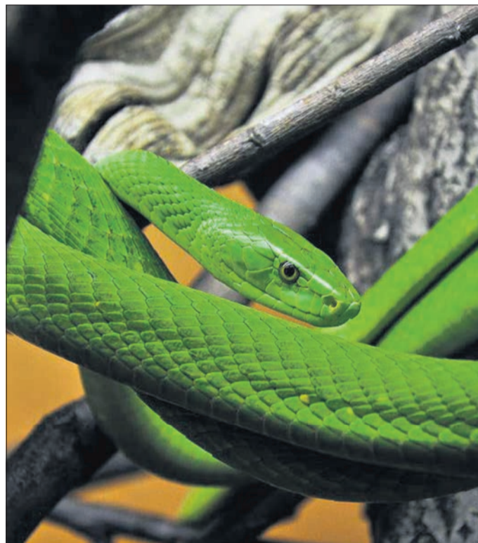
Tierisch giftig: Die blattgrüne Mamba stammt aus Afrika und ist ausgewachsen bis zu zwei Meter groß.

bis zum 11. April verlängert. Insgesamt 125 Geschichten bieten verschiedene Perspektiven auf 41 Objekte der Naturkunde und der Ethnologie.