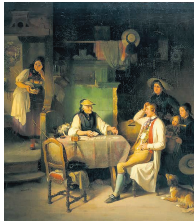
Die Kartenschlägerin aus dem Jahr 1846, gemalt von Johann Baptist Kirner.

Von den Römern über die Alemannen bis hin zu den Zähringern: Die Jubiläumsausstellung „freiburg.archäologie – Leben vor der Stadt“ wird bis zum 9. Januar 2022 verlängert und zeigt Geschichten mehrerer Tausend Jahre Siedlungs- und Menschheitsgeschichte