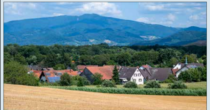
Benzhausen: Freiburgs nördlichster Teil mit Blick auf den Kandel.

Gleiches gilt für den Nimberg, der auch Marchhügel genannt wird, ein knapp 254 Meter hoher Hügelrücken, über den man nach Benzhausen laufen kann. Hier schweift der Blick zum Kandel, Feldberg und Schauinsland. Von der nicht weit entfernten A5 sieht man im Sommer wegen der grünen Bäume wenig, doch der Verkehrsstrom ist zu hören. Und der seit Jahrzehnten fehlende direkte Anschluss der Bebelstraße an den Autobahnzubringer (B 294) und damit an die Anschlussstelle Freiburg-Nord ist ein Thema, das die Menschen in Hochdorf umtreibt. 200 Firmen mit 4500