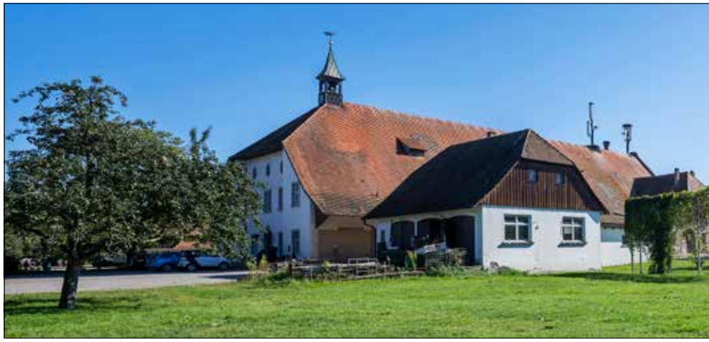
Aus Alt mach Neu: Aus der historischen Schmiede soll eine „Zukunftsschmiede“ werden, aus dem Dachgeschoss des früheren Kuhstalls (unten rechts) eine Spielscheune.

Mit weitläufigen 38 Hektar Fläche und rund 400 Tieren – vom Wollschwein bis zum Gibbon – ist der Mundenhof zwar das größte Tiergehege Baden-Württembergs. Doch seine wachsende Beliebtheit und die bis zu 16000 Menschen, die künftig in Dietenbach wohnen werden, bringen ihn an seine Grenzen. Diese sind, neben dem neuen Stadtteil, ein Naturschutz- und ein Vogelschutzgebiet sowie im Westen die A5. „Das bedeutet: Wir können uns nicht in der Fläche erweitern,