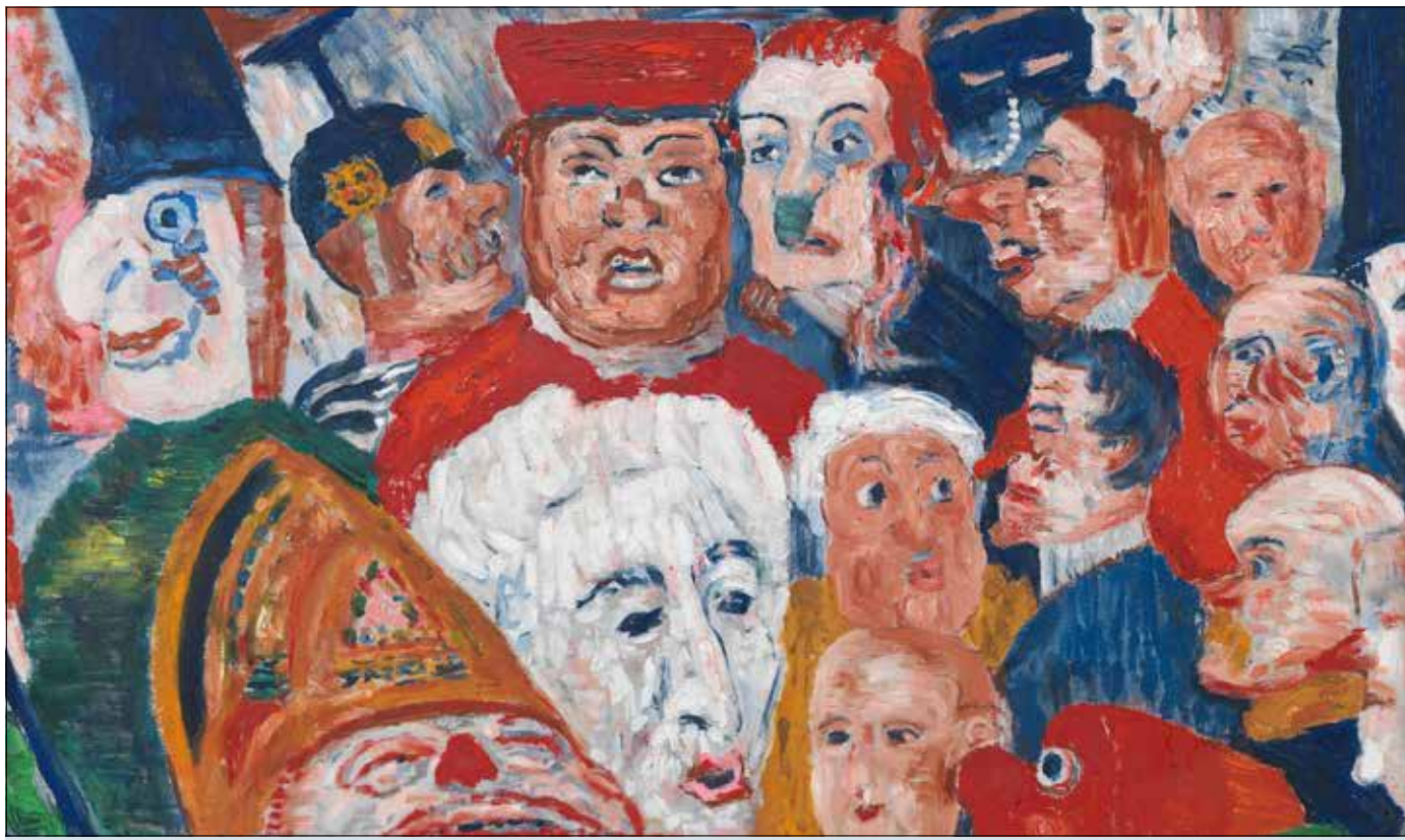
„Köpfe – maskiert und verwandelt“ im Museum für Neue Kunst Das menschliche Gesicht in all seinen Facetten erleben: Das können Besucherinnen und Besucher ab jetzt im Museum für Neue Kunst. Die neue Ausstellung „Köpfe – maskiert, verwandelt“ umfasst rund 90 Gemälde, Skulpturen und Grafiken, die vom 14. Jahrhundert bis in die Gegenwart reichen. Allen gemein ist eine Faszination vom Gesicht als Spiegel von Emotionen. Auch das Verstecken und Verwandeln von Gesichtern steht im Fokus der Privatsammlung, die Inspiration in den traditionellen Holzmasken der Elzacher Fasnet findet. Die Ausstellung ist bis zum 14. Februar zu sehen.

Haus der Graphischen Sammlung Im Schwabentor, Tel. 24321 www.planetenarium-freiburg.de Mo–Fr 14.30–17 Sa/So 12–14 Uhr • Tag der offenen Tür Di, 3.10. 11–16 Uhr • Umbaupause bis 28.10. • Ab dem 4.10. in der Winterpause