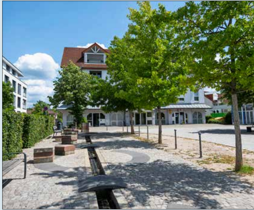
Moderne Ortsmitte: Der Högebrunnenplatz mit seinem zeitgenössischen „Freiburger Bächle“. Unten links die katholische Kirche St. Martin.

Nicht alles ist rosig in Hochdorf. Das zeigt sich auch am Högebrunnenplatz mit seinem Bach, wo neben der Apotheke und Arztpraxen einst ein Café und die Volksbank ansässig waren. Beides sei wichtig gewesen für die Menschen, sagt der Ortsvorsteher. „Ein neues Café wünschen sich viele, und es wäre für den schönen Platz eine Bereicherung.“ Jetzt gebe es nicht mal mehr einen Geldautomaten,