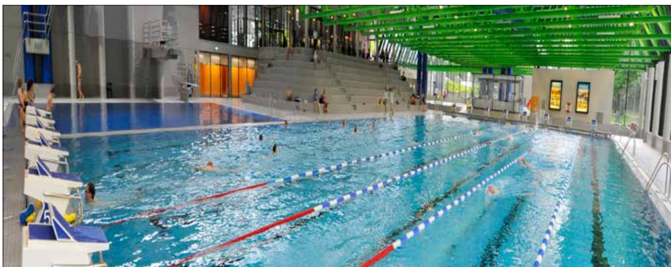
Der Sprung ins kühle Nass kostet künftig für viele, aber nicht für alle mehr Geld.

Zum letzten Mal waren die Preise für Freiburgs fünf Hallen- und drei Freibäder 2017 erhöht worden, während der Corona-Zeit verzichtete die Stadt wegen der eingeschränkten Öffnungszeiten auf Preissteigerungen. Die Personalkosten sind seit damals allerdings erheblich gestiegen: von 3 auf 3,6 Millionen Euro im Jahr