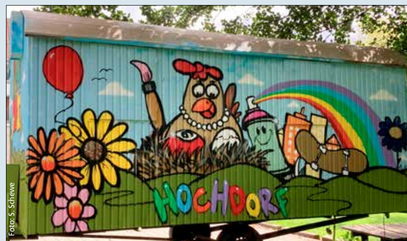
Bunt und fantasievoll: bemalter Bauwagen beim Jugendzentrum.