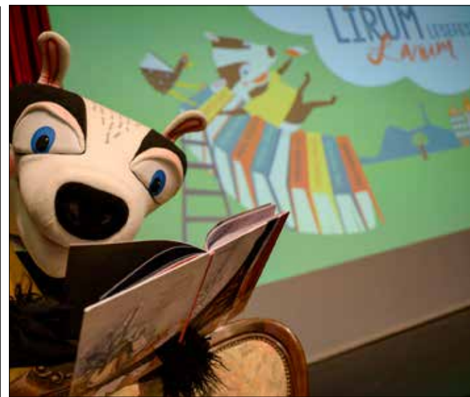
Der Lesedachs: Das legendäre Maskottchen steht auch dieses Jahr wieder auf der Bühne.

Ebenfalls am Sonntag, 8. Oktober, um 15 Uhr lädt das Literaturhaus (Bertoldstr. 17) kleine Zeichnerinnen und Zeichner und Reimefans an den Maltisch ein. Zwei Bilder und ein knackiger Zweizeiler