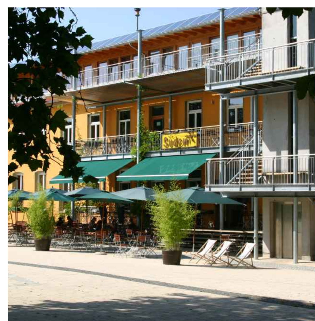
Bürgerhaus - the community center