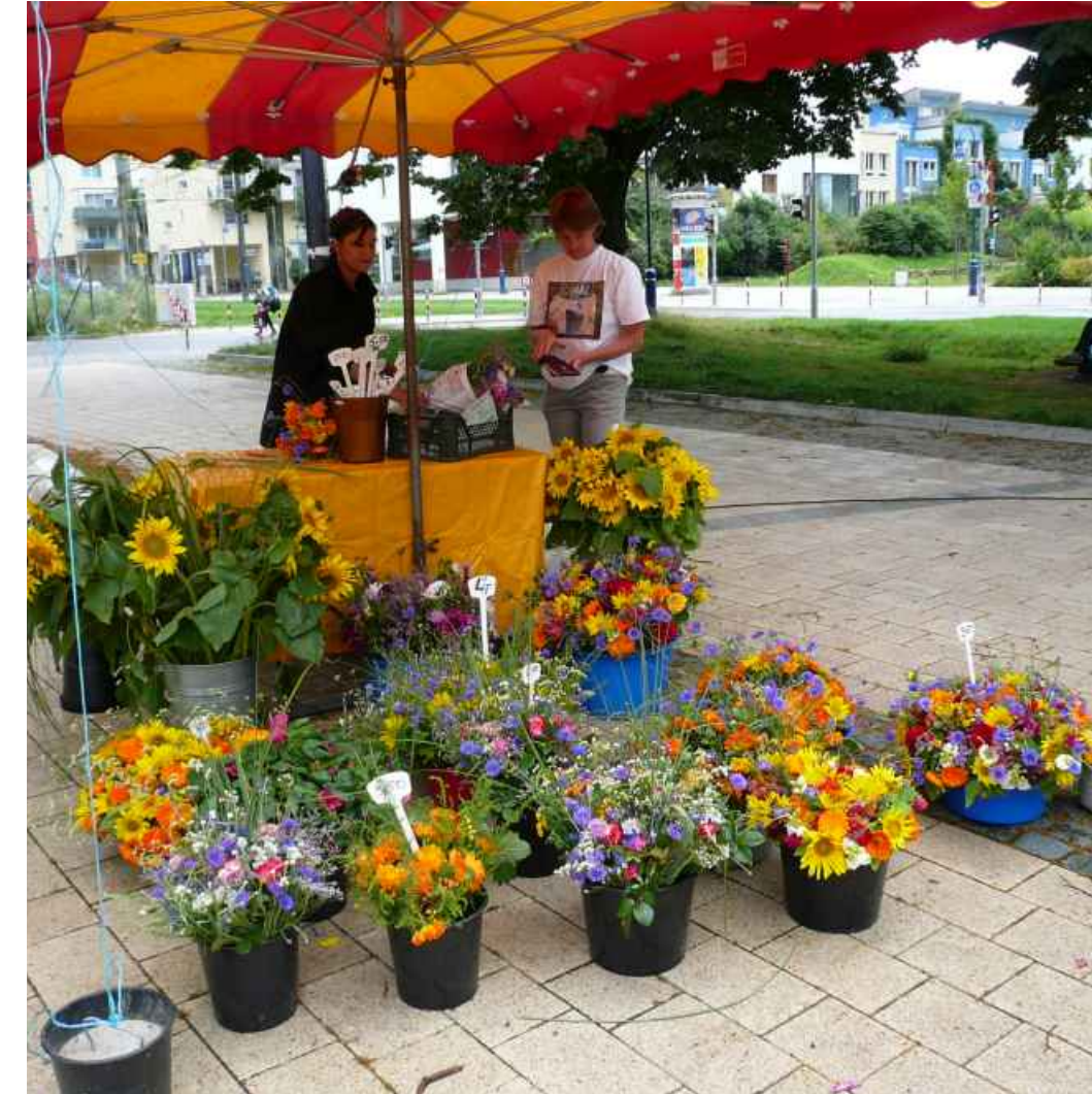
Bauernmarkt - Farmers' market