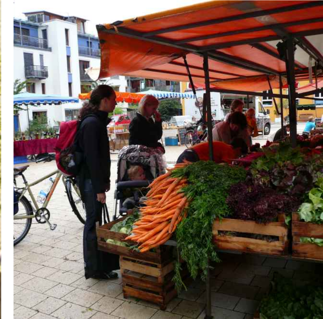
Bauernmarkt - Farmers' market