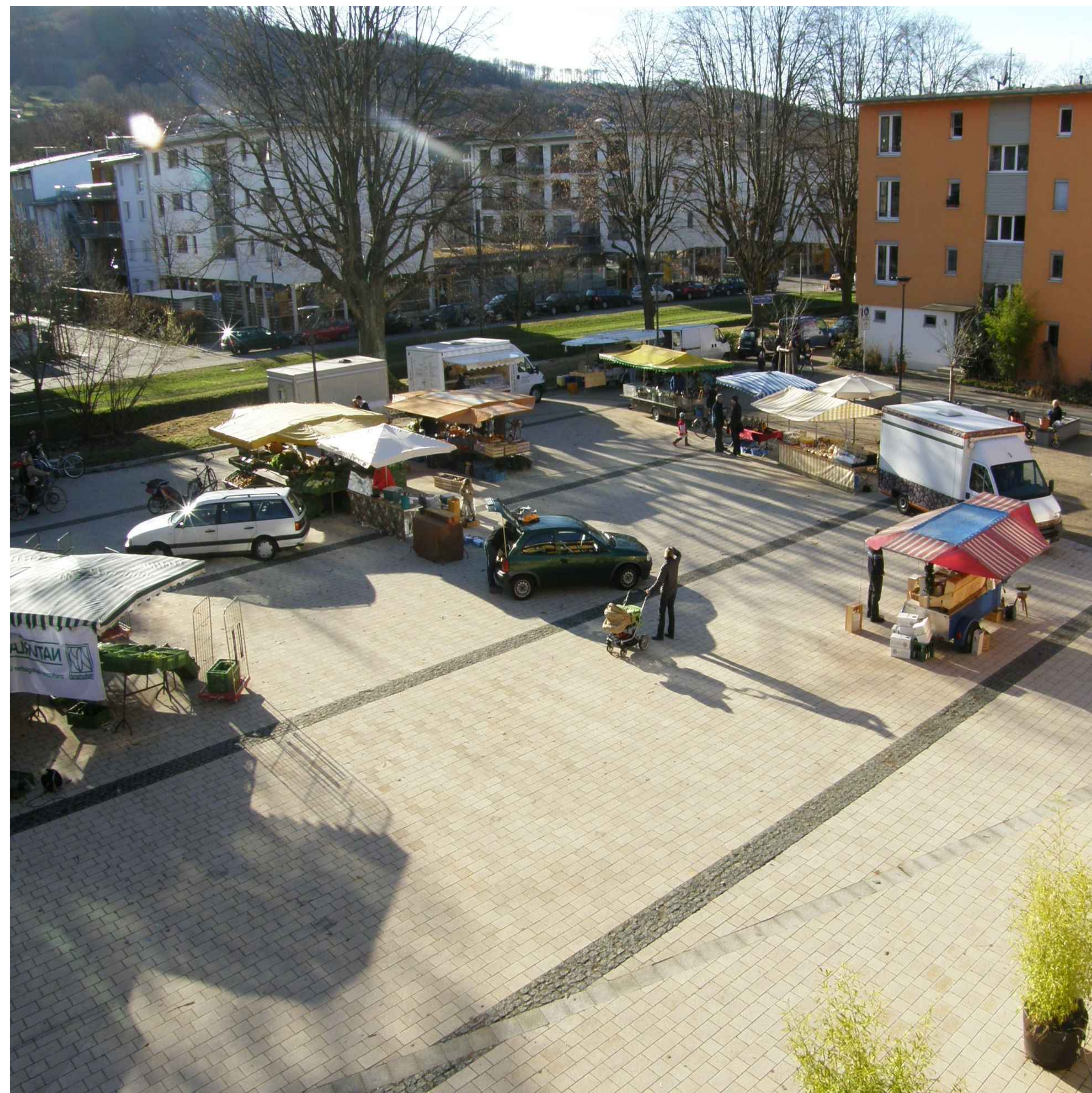
Alfred-Döblin-Platz / mit Bauernmarkt - The public square with farmers' market