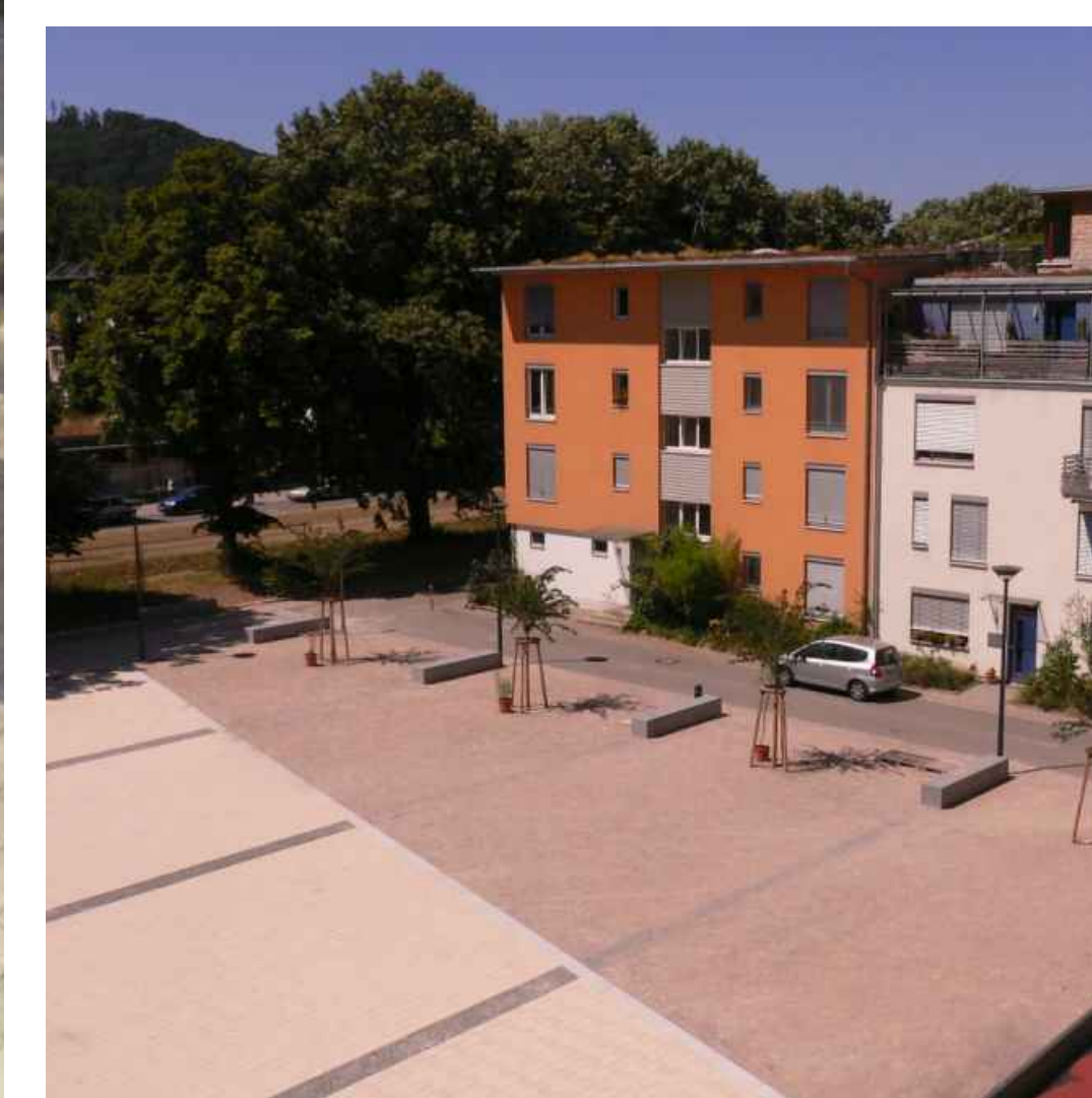
A.-Döblin-Pl. / Randbebauung - frontage development

The design of the town planning office for the Alfred-Döblin-Platz is based on the basic considerations of the "Arbeitskreis Marktplatz Vauban" (workshop for a marketplace at Vauban). Accordingly the already established use of the space as a multifunctional area was to be maintained as well as expanded further. Many different activities were to be made possible and only a few things to be prevented. The design principle of the square is fashioned so that the existing area was maintained in its current dimensions while an extension in the shape of a turned rectangle facing the Paula-Modersohn-Platz was added as well as a zoning of the space itself. This is achieved by the use of granite strips running from east to west connecting the different sub-areas of the square. The strips can later be inscribed with citations from the works of poet Alfred Döblin and serve a visible reminder of the poet the square is named after.