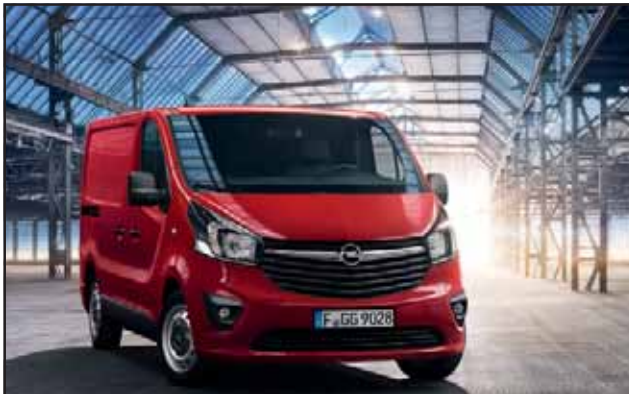
Abb. zeigt Sonderausstattung