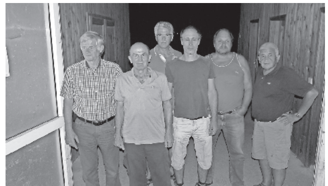
Herzlichen Dank für dieses Beispiel ehrenamtlichen Engagements.